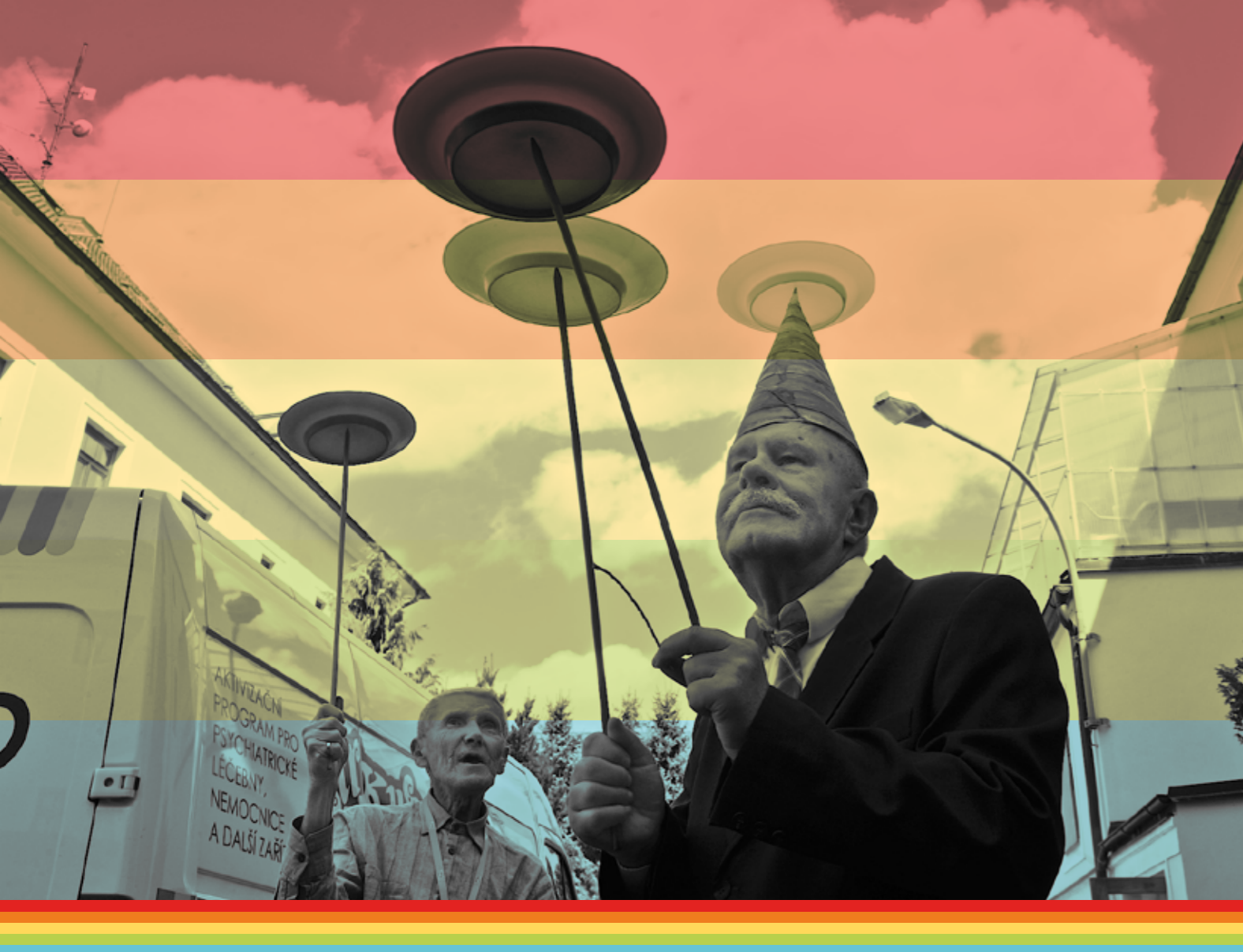
Cirkus Paciento v Libníči v roce 2014

„Ústav néjni žádnej cirkus a Cirkus néjni žádnej ústav, milej pane“ (autor neznámý: diskuse k transformaci ústavní péče 2014 :o)